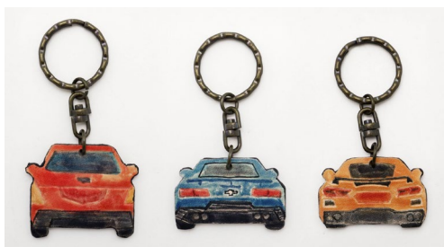
▲制作イメージ：裏面