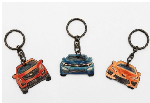
▲制作イメージ：表面